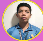
G. Glyde Patonongon Pantabas na Tagapamayaga