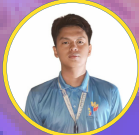
G. JD A. Arong PANGALAWANG PANGULO