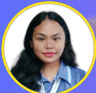
Bb. Imie Aldoyesa Panloob na Tagapagballa